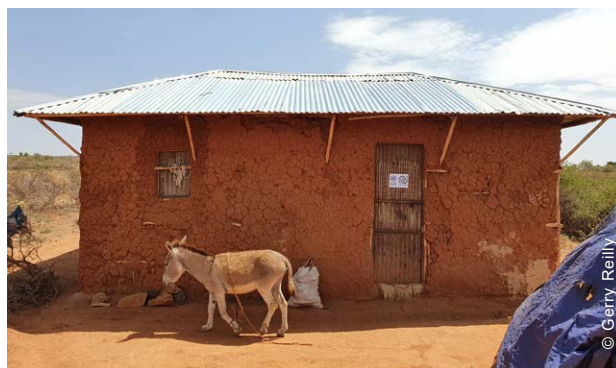
O projeto apoiou quem as famílias que podiam reparar as respetivas casas parcialmente danificadas, quer as famílias cujas casas não podiam ser reparadas e precisavam de ser reconstruídas.