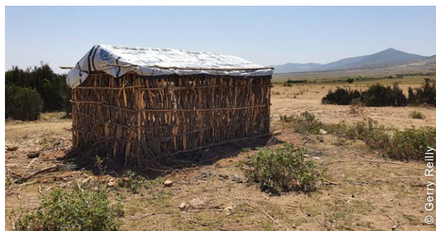
As lonas de plástico distribuídos durante a primeira prestação foram utilizados como material de cobertura provisório antes de as famílias receberem a segunda prestação.

Segunda prestação: Disponibilizou-se o valor de 90 USD a cada famílias com a condição de que todos os membros do grupo tivessem concluído a estrutura primária e que isto fosse verificado pela organização. Estes 90 USD foram calculados de modo a serem suficientes para comprar e instalar chapas de ferro galvanizado corrugado (CGI, na sigla em inglês) para cobrir o telhado de um abrigo de 20 m 2 com base nos preços do mercado local.