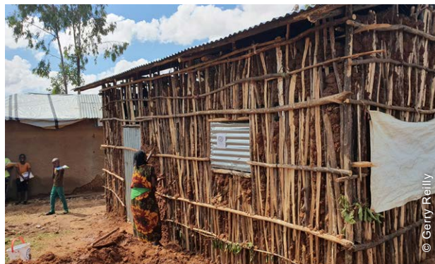
Tipicamente, a principal tipologia de abrigo na zona leste de Hararghe é uma estrutura em madeira que consiste em estacas de madeira que são colhidos localmente, em preenchimento de madeira feito a partir de arbustos selvagens e em paredes rebocadas de barro.