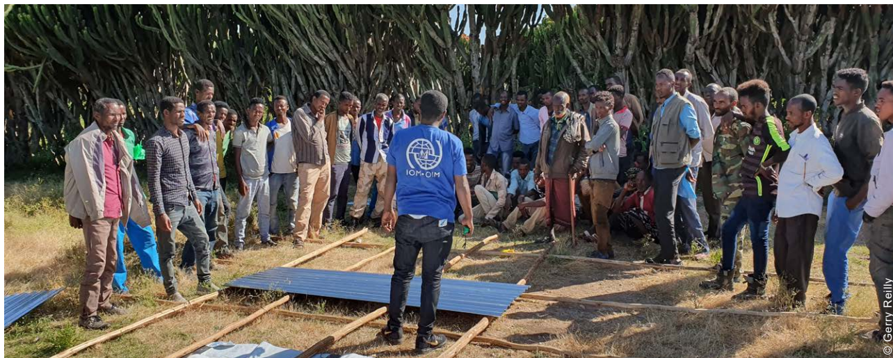
A formação de carpinteiro foi realizada nas aldeias com ênfase nas demonstrações práticas de técnicas para melhorar a durabilidade das estruturas.

Como resultado da análise, optou-se por utilizar uma modalidade de Assistência em Dinheiro (CBI, na sigla em inglês) para apoiar as reparações e as reconstruções, e o apoio em matéria de Casa, Terra e Propriedade (HLP, na sigla em inglês) foi integrado como uma componente fundamental no âmbito do projeto.