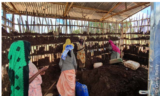
Cada grupo de 12 famílias foi responsável pelo progresso de todos os abrigos do grupo, com vista a que o grupo se qualificasse coletivamente para a etapa seguinte de assistência. A imagem acima mostra um grupo de mulheres a realizar um reboco de barro.

Em projetos-piloto anteriores incluindo assistência em dinheiro, verificaram-se, em muitos casos, atrasos nos projetos devido ao facto das famílias concluírem o seu trabalho em diferentes etapas. O agrupamento de famílias em grupos de 12 fomentou uma dinâmica comunitária que apoiou a implementação. Em muitos casos, os grupos combinaram o seu dinheiro e negociaram os preços do material, do transporte e da mão de obra. Esta solidariedade entre as pessoas da aldeia ajudou especialmente as famílias mais vulneráveis, sendo que tarefas como o transporte de material do mercado para as aldeias foram feitas de forma coletiva e não individual. Como resultado, todos os agregados familiares e grupos se qualificaram ao longo das etapas para receberem a assistência completa. As famílias relataram que acolheram favoravelmente a responsabilização formal dos membros do grupo dentro do sistema de grupo, visto que isto reduzia o risco de uma família ao qual se forneceu dinheiro decidir não o gastar em materiais de abrigo, conforme pretendido. Em vez de receberem as prestações em dinheiro nas suas aldeias, os membros das famílias preferiram deslocar-se até ao mercado da cidade para receber o dinheiro, para poderem comprar os materiais imediatamente.