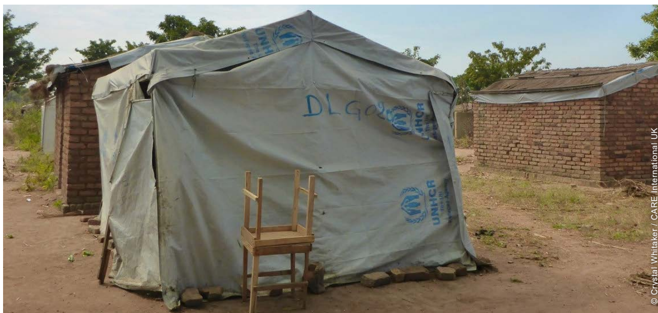
Un abri d'urgence en bâches types utilisé avant la construction d'abris semi-durables (camp de réfugiés de Dilingala, Moissala).